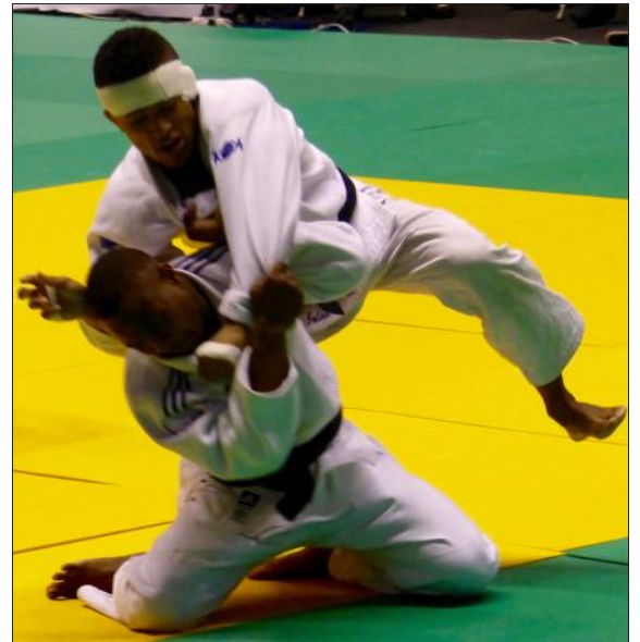
■ La concurrence était rude hier sur les tatamis de Gerland.