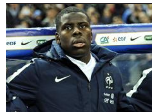
■ Kurt Zouma.