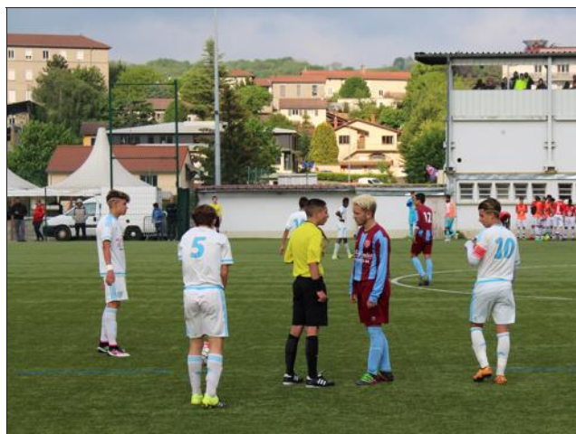
■ Bourgoin-Jallieu a largement tenu tête à l'Olympique de Marseille, dans un match très disputé.

PRATIQUE Des maillots et des polos sont à gagner.