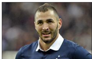
■ Karim Benzema.