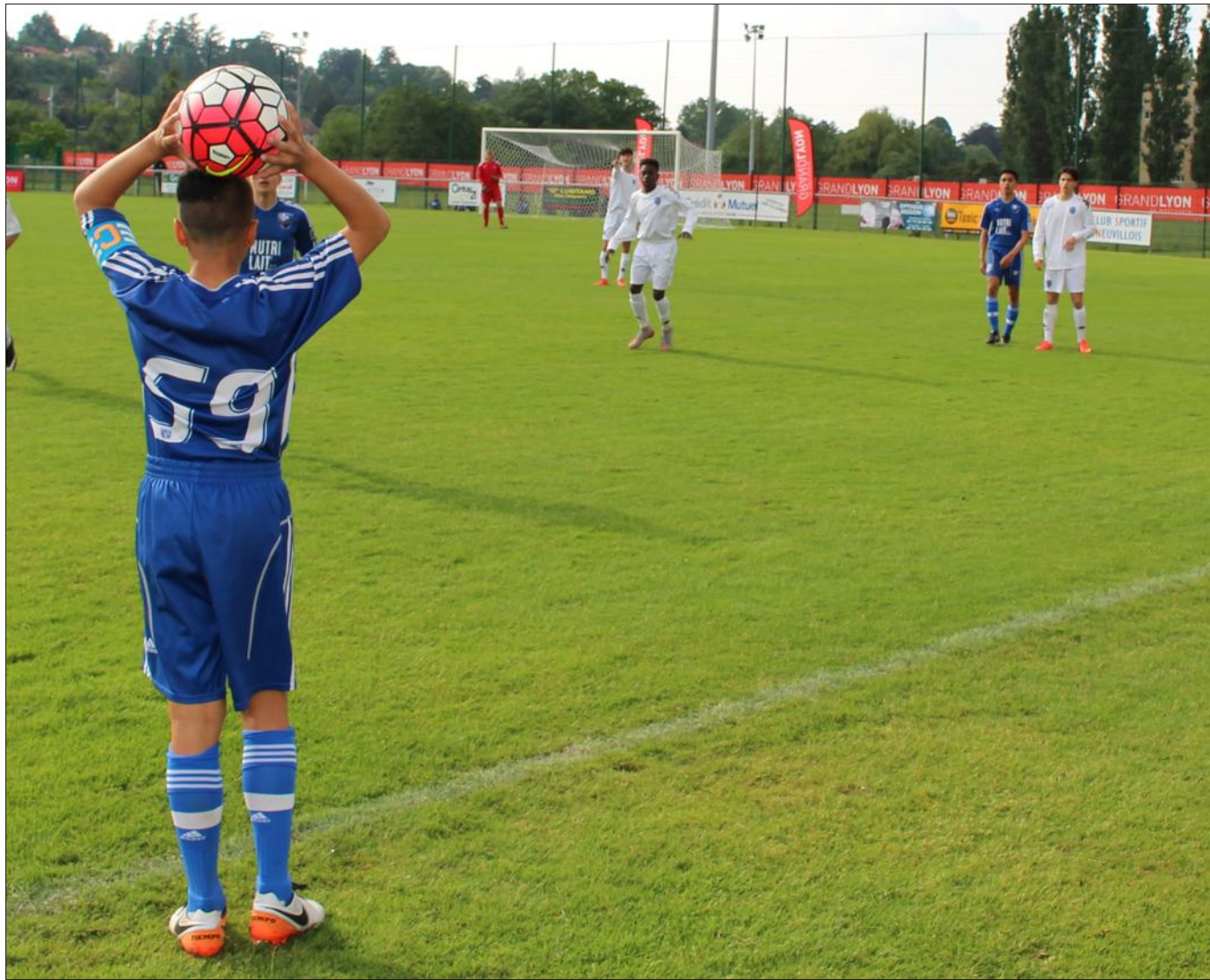
■ L'Impact de Montréal à la lutte avec l'Estac (Troyes), lors de cette première journée de tournoi.

De leur côté, les Portugais du Sporting sont en bonne position pour se qualifier en quarts de finale, grâce à une victoire et un nul. Enfin, les locaux de Neuville n'ont pas eu beaucoup de réussite en s'inclinant à deux reprises. Mais ils apprennent au contact des meilleurs.